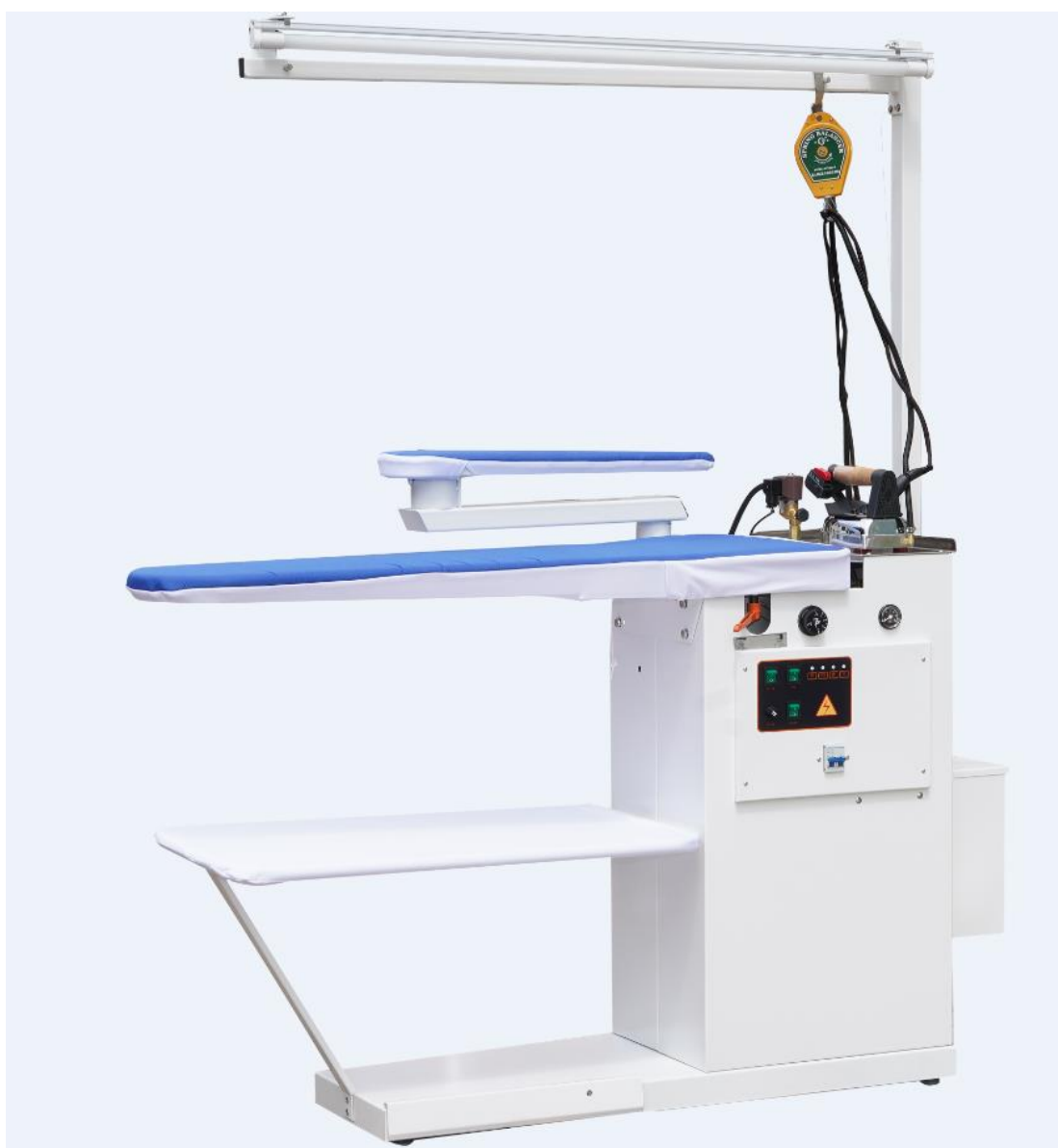
Figura 1 NS-TDZG-Q III mesa de passar roupa tipo bico de pato com caldeira (frente)