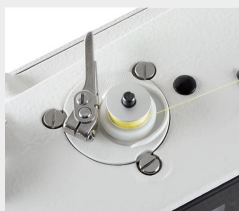
Enchedor de Bobina