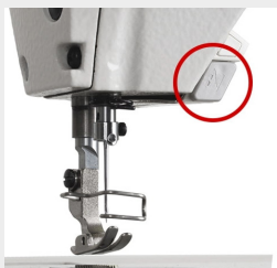
Botão posicionamento da agulha

Para diversos processos de costura, com utilização de aparelhos e calcadores. É possível fazer costuras como: bainhas, pespontos e zíper, entre outras. Utilizada em tecidos jeans (pesados).