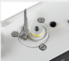
Enchedor de Bobina