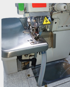
BKT Arremate automático